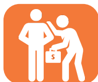
Tráfico de influencias