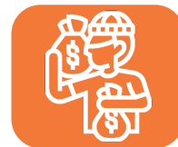
Conspiración para cometer actos de corrupción.