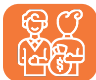
Desvío de recursos