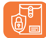
Uso ilegal de información confidencial